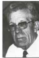
Hans Asperger (1906 - 1980)

Los padres y madres sufren enormemente este síndrome, dado que nadie del entorno puede entender como un niño/a aparentemente normal, inteligente incluso, puede tener una discapacidad social tan importante y parecer tan excéntrico. Muchas veces el entorno busca la causa en una adecuada educación. Esta incomprensión del entorno, junto a las dificultades adaptativas, sociales y conductuales del hijo/a, provoca en los padres un aislamiento social permanente y muy doloroso. Mientras la sociedad no cambie esta mentalidad sobre el mundo de la discapacidad (en todas y cada una de sus manifestaciones), será muy difícil una verdadera y completa integración social, en este caso de las "discapacidades sociales".