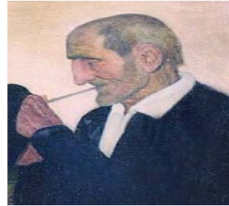
Ramón de Zubiaurre. Personaje con pipa (fragmento)