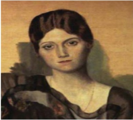
Pablo Ruiz Picasso. Retrato de Olga en un sillón . 1917 (fragmento)