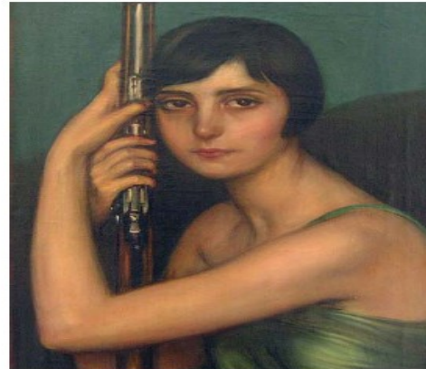
Julio Romero de Torres. La escopeta de caza . 1929. (fragmento)