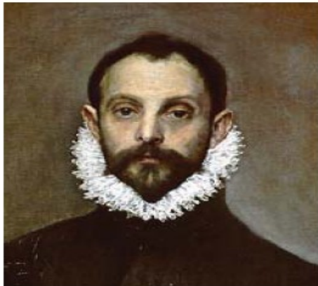
El Greco. El caballero de la mano en el pecho . Circa 1578 (fragmento).