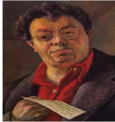
Diego Rivera. Autorretrato . 1941